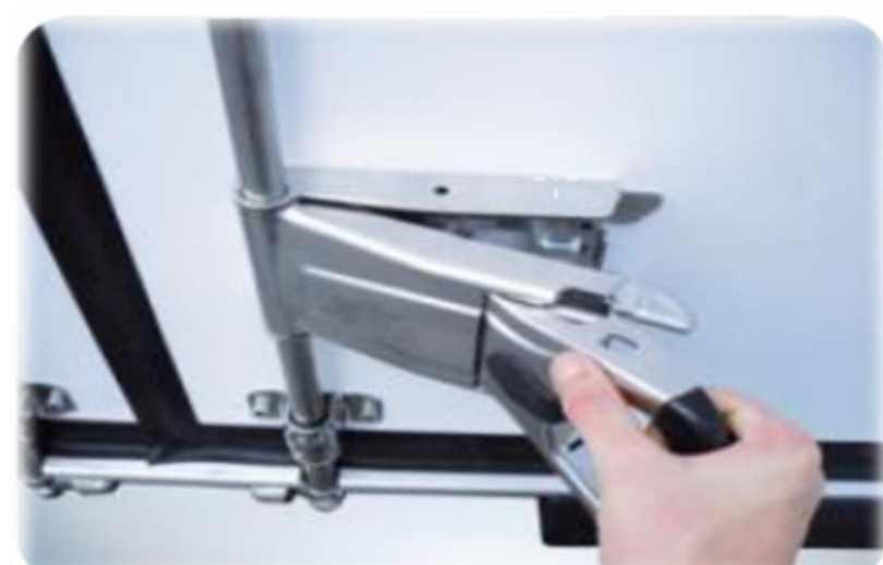
Нова ручка "Easy Handle" з одним рухом, на задніх дверях