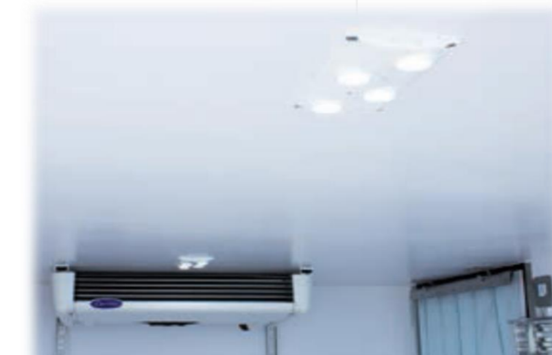
Світлодіодний світильник з перемикачем всередині кабіни

* Всі зображення автомобіля, кузова та салона наведені як приклад і можуть відрізнятися від фактичного