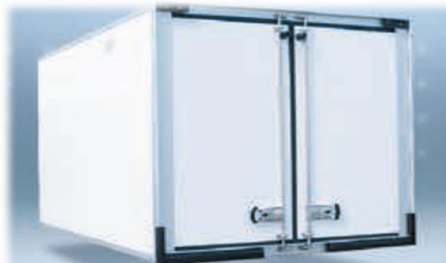
Композитні панелі (харчовий гелеобразний шар - поліефір - поліуретан), оснащені алюмінієвими вставками